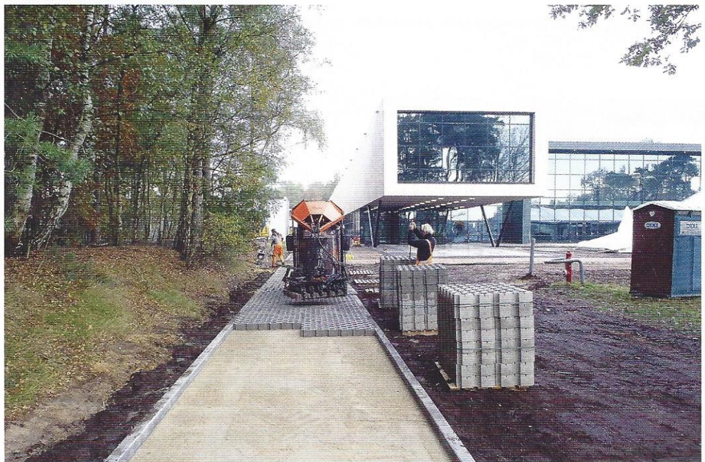
De verharding rondom het kantoor van NOC*NSF op Nationaal Sportcentrum Papendal in Arnhem is machinaal bestraat door Boerman Hovenier en Bestratingen.

„Eeuwige roem. Nee zonder dollen, het is goed voor onze naamsbekend richting leveranciers en opdrachtgevers: je hebt iets om mee voor de dag te komen.” <